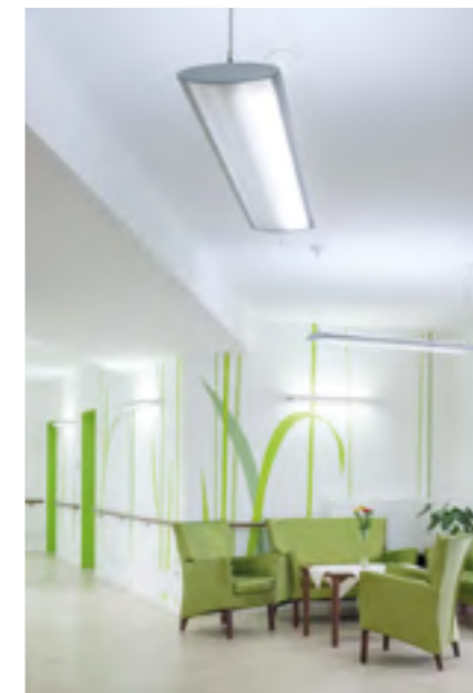
VISUAL TIMING LIGHT

Im Foyer, im Restaurant, in allen Fluren und Aufenthaltsbereichen simuliert das zeitgesteuerte Lichtmanagementsystem VTL den Tageslichtverlauf automatisch. Gleichzeitig werden die Anforderungen nach VDI 6008 zur Barrierefreiheit erfüllt.