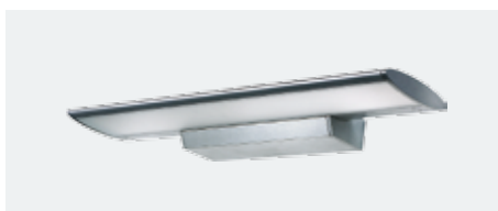
D-lite® amadea 2x39 W