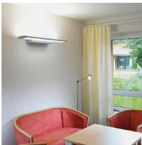
Wohnlich: Milieugerechte Beleuchtungsstärke