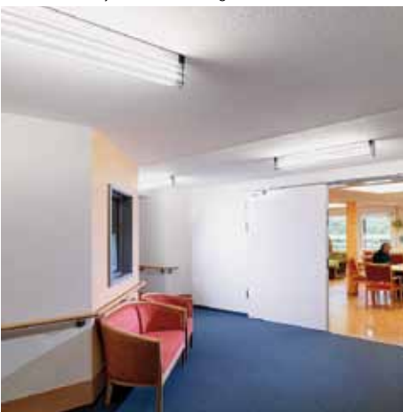
Gut gelöst: Durch eine spezielle Anordnung der Deckenleuchten wird jeder Winkel ausgeleuchtet