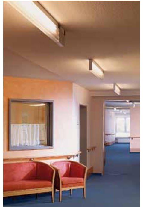
Abend: Beruhigende und gemütliche Abendstimmung