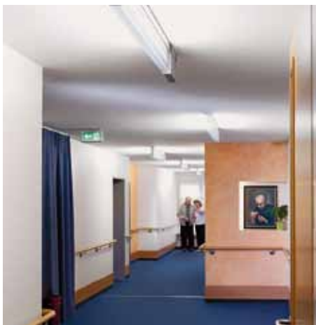
Hell: Tageszeit entsprechende Helligkeit