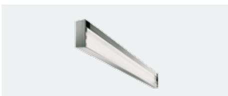
D-lite® vanera High-End 54/54 C