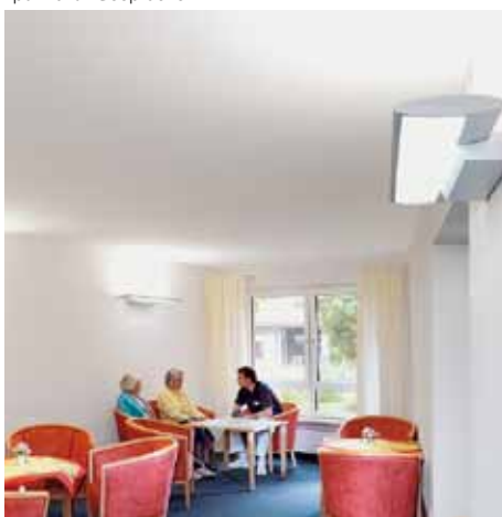
Freundlich: Gemeinschaftsbereich dient als Treffpunkt für Gespräche