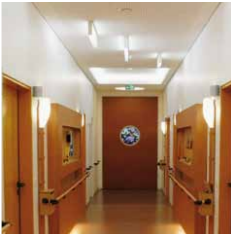
Finde den richtigen Weg: Zusammenspiel von Licht und Bodenwahl