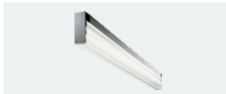
D-lite® vanera High-End 54/54 C, Eco D-lite® vanera High-End 39/39 C, Eco