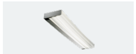
D-lite® vanera 39/39 W, Eco