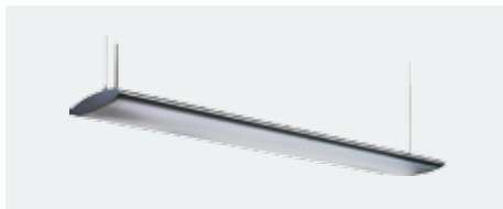
D-lite® amadea 2x54 C