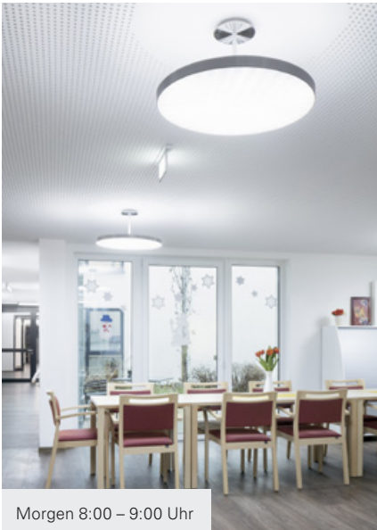
Morgen 8:00 – 9:00 Uhr

Hier verändert sich die Beleuchtungsstärke und die Lichtfarbe im Tagesverlauf: vom Sonnenaufgang bis zum Sonnenuntergang bis zur Nacht. Oberstes Ziel ist die Aktivierung der Bewohnerinnen und Bewohner, sowie die Verbesserung des Tag-Nacht-Rhythmus.