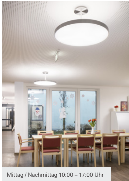
Mittag / Nachmittag 10:00 – 17:00 Uhr